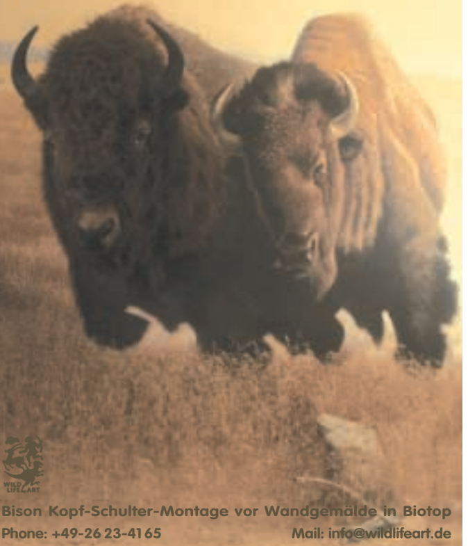
Bison Kopf-Schulter-Montage vor Wandgemälde in Biotop Phone: +49-26 23-41 65 Mail: info@wildlifeart.de

Gebiet gut auskennen. Drei Freunde versuchten vor zwei Jahren in ein Gebiet vorzudringen, wo Bisons stehen sollten. Nach sieben Tagen harter Arbeit mit Kettensäge und Axt gaben sie auf, ohne nur eine Spur von Bisons gesehen zu haben.