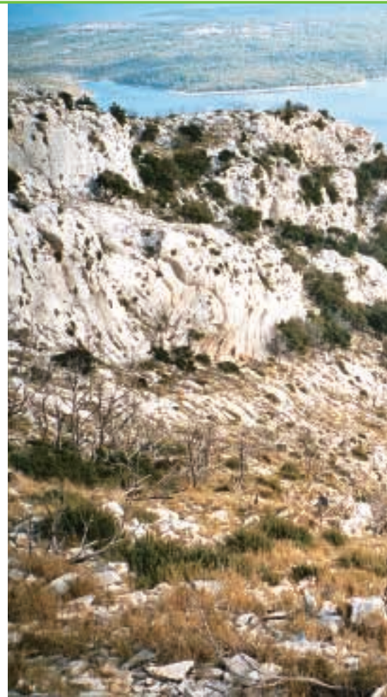
BLICK VON DER INSEL HVAR, WO DIE ZIEGEN ZUR STRECKE GEKOMMEN SIND.