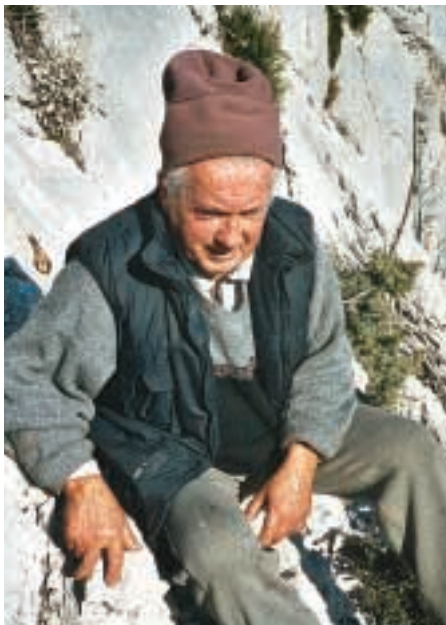
DER „ZIEGENMANN“, DER DIE EINSTÄNDE DER VERWILDERTEN ZIEGEN KANNTE WIE SEINE WESTENTASCHE.

Im Gegensatz zu „normalen“ Bergen liegen hier die Felsbrocken nicht terrassenmäßig über- oder nebeneinander, sondern stecken mit der kurzen Seite senkrecht im Boden. Ein Fehltritt und man steckt mit den