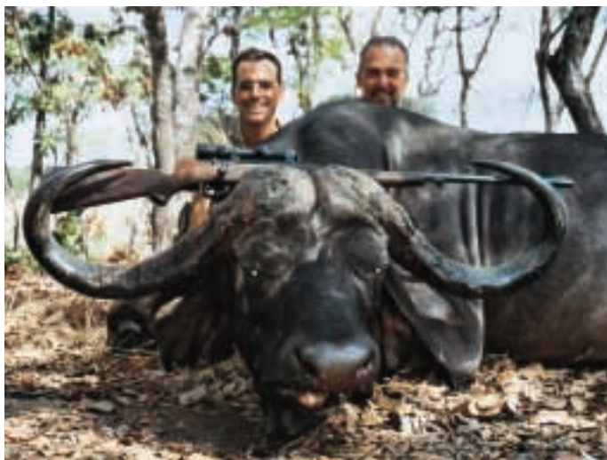
ABB. 5: EIN WIRKLICH KAPITALER BÜFFEL MIT EINER AUSLAGE VON 49 INCH!

Preise meist in US-Dollar zu bezahlen sind, birgt das Währungsrisiko eine nicht zu unterschätzende Kostenvariable. Da die Veranstalter die staatlichen Gebühren und Abschusslizenzen ebenfalls in US-Dollar begleichen müssen, ist davon auszugehen, dass auch in Zukunft an dieser Währung festgehalten wird.