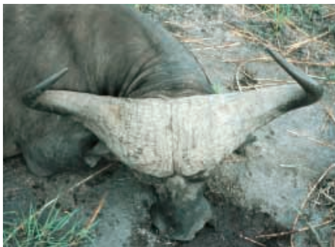
ABB. 2: DIESER BÜFFEL IST NUR MITTELALT, TROTZ GESCHLOSSENEM „BOSS“.

hes Wasserangebot bei einem zu frühen Termin bedeuten, dass unter Umständen wenig oder keine Büffel in Anblick kommen, da im Hinterland noch ausreichend Wasser in den schwer zugänglichen, meist hügeligen Gebieten des Reviers zu finden ist, sodass die Büffel noch gar nicht in die erschlossenen Teile der Jagdgebiete vordringen. So kann sich ein im April büffelleeres Gebiet im Dezember in ein sehr gutes Jagdgebiet wandeln.