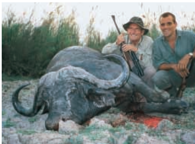
ABB. 3: ALTER BULLE. DIE „TIPS“ STUMPFEN AB UND DIE HORNOBERFLÄCHE VERLIERT AN MASERUNG.

Der Preis sollte in diesem Analyseprozess noch nicht von entscheidender Bedeutung sein. Erst danach gilt es zu überprüfen, ob der Reisepreis dem gesetzten Budget entspricht, oder ob nach-