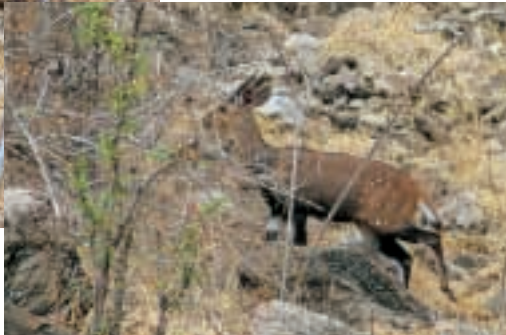
BUSCHBÖCKE: LINKS DAS HELLE WEIBLICHE STÜCK, UNTEN EIN JUNGER BOCK.

die Fotomaschine. Auf viel be- laufenen Wechsellern graben sich unsere Schuhe teils tief in den Sand, dann geht es wieder über steinharten, ausgedörrten Bo- den. Goldgelbes Gras streicht um die Beine. Immer wieder kommen wir an Wild. Elandan- tilopen, Gnus und Impalas se- hen wir viele. Am beein- druckendsten ist jedoch die Warzenschweindichte. Es verge-