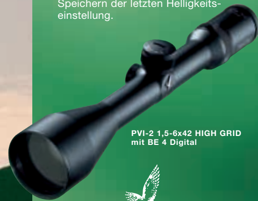
PVI-2 1,5-6x42 HIGH GRID mit BE 4 Digital