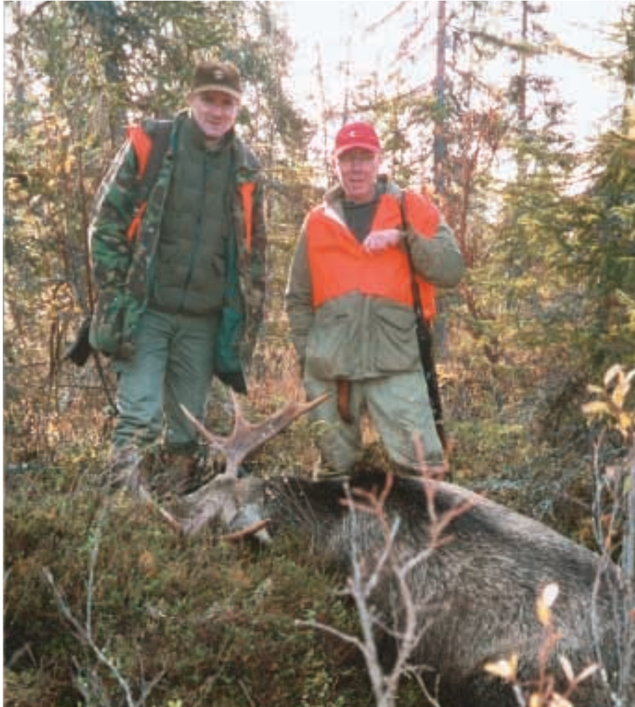
BEIM TREIBEN ERLEGT: PETRAS ZWEITER ELCH.

nen Moorflächen, hört die rufende rote Treiberschar sowie das rhythmische tröt, tröt der mitgeführten Hupen und Hörner. Kommt ein Elchbulle vor, steigert sich das Rufen zum Stakkato: Hirvileh - Hirvileh (Hirsch)!