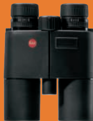
LEICA GEOVID 8 x 42 BRF

Leica Camera AG / Oskar-Barnack-Straße 11 / D-35606 Solms / Telefon 06442-208-111 / www.leica-camera.com