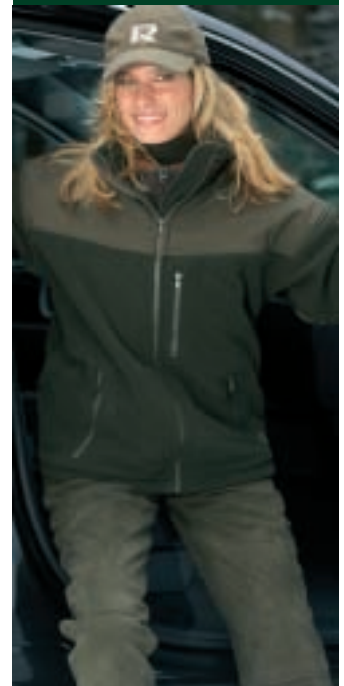
Funktionelle Jagdjacke Form 319004 • Artikel: 9452/1