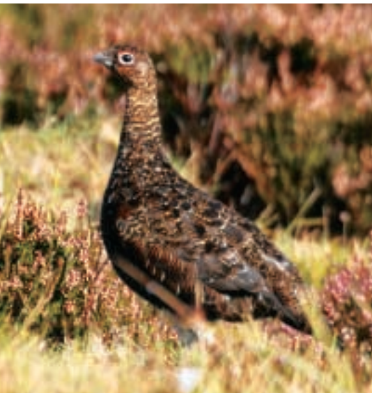
„FAMOUS GROUSE“ – DER BEGEHRTESTE JAGDVOGEL DER WELT.

Am Ende dieses herrlichen Jagdtages blicken wir zwar auf keine spektakuläre Strecke, wohl aber zurück auf eine Fülle wunderbarer Erlebnisse – und genau das macht eine gute Jagd für mich aus! Schützen, Treiber und Hundeführer stehen fröhlich plaudernd zusammen, bewundern die eine oder andere edle Flinte, kommentieren getroffene sowie vorbei geschossene schnelle „Birds“ und lassen so den Tag Revue passieren. Es ist erfrischend zu sehen, dass auf diesem Estate die Geselligkeit und keine