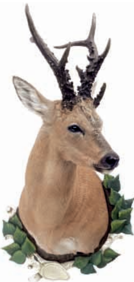
Sibirischer Rehbock Capreolus pygargus

Karl Matt A-6832 Röthis Wingatweg 10 Tel +43/5522/44 0 88 Fax +43/5522/44 0 88-4 karl.matt@aon.at www.karlmatt.com