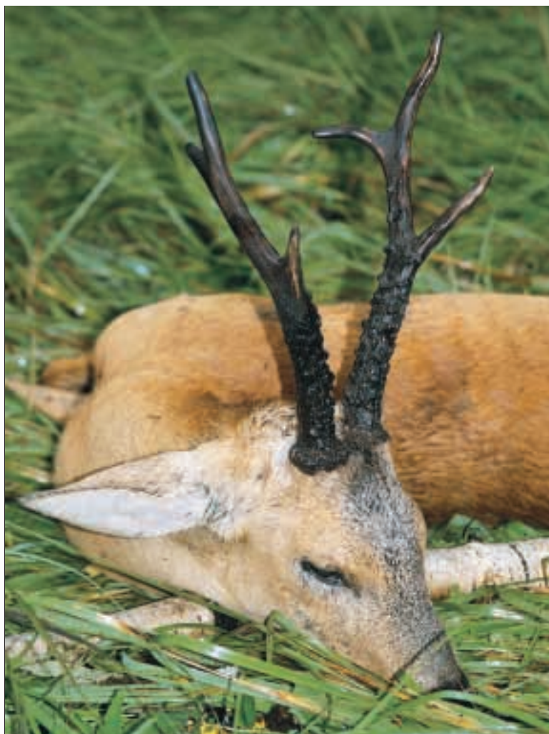
LICHTE BIRKENWÄLDER IM SIBIRISCHEN KURGAN: HIER SPRANG EIN BOCK MIT 950 GRAMM GEHÖRNGEWICHT AUF DAS BLATTEN ZU.