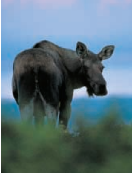
ELCHWILD IST EINE DER CHARAKTERWILDARTEN LETTLANDS.

So geht es noch am Nachmittag an einen kleinen Kanal, an dem Martins die Biber-route festgemacht hat: Hier sollen sie vorbeirinnen und ich ausharren. Also hocke ich mit Flinte und Zwei-Millimeter-Schrot an Erlen gekauert an diesem Wasserlauf. Der Wind passt, es ist nicht zu kalt, und so verstreicht die Zeit. Schüsse sollten auf Biber nicht von vorne abgegeben werden, damit man die Zähne und den Schädel nicht zerstört, sondern leicht von hinten auf den Hals/Wildkörperbereich.