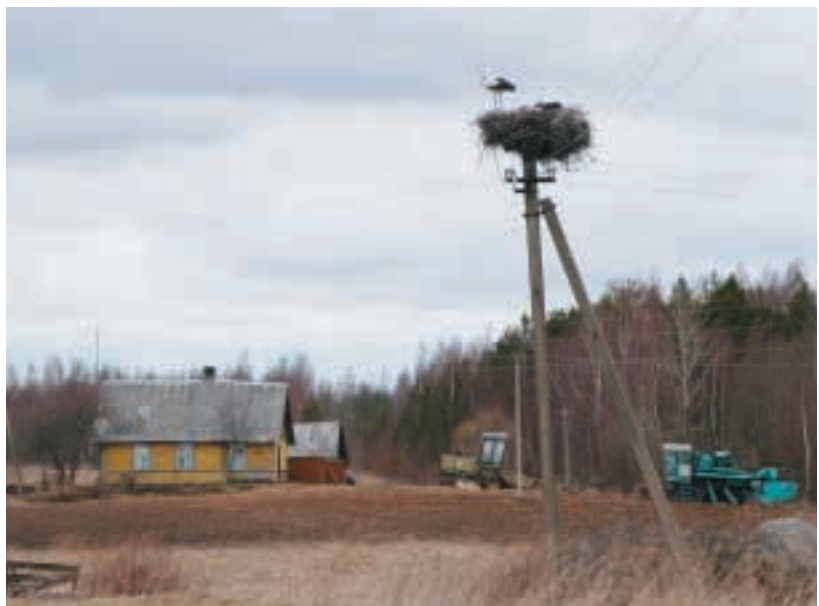
TYPISCHER HOF AUF DEM LANDE. STÖRCHE SIND LANDESWEIT ZU FINDEN.

dieser langen Zeit unter Wasser sind die unteren Schichten des Felles und die Oberhaut noch völlig trocken.