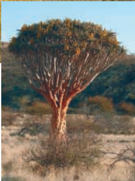
DIE VEGETATION AUF DER FARM IST ÜBERRASCHEND VIelfÄLTIG. HIER BEISPIELSWEISE EIN KÖCHERBAUM.