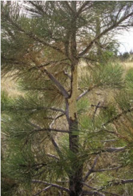
PIRSCHZEICHEN: GEFEGTE KIEFER.

Langsam fahre ich nochmals hinein ins Leben und halte diesmal wegen des Hochschusses der Büchse tief Blatt. Grelles Mün-