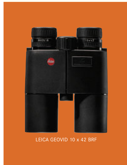
LEICA GEOVID 10 x 42 BRF

Leica Camera AG / Oskar-Barnack-Straße 11 / D-35606 Solms / Telefon 06442-208-111 / leica-camera.de